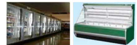
<冷凍冷蔵ショーケース>

お問合せ先： 環境省 地球環境局 地球温暖化対策課 フロン対策室 電話：0570-028-341