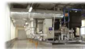
<中央方式冷凍冷蔵機器>

フロン類ではなく、アンモニア、二酸化炭素、空気等、自然界に存在する物質を冷媒として使用した冷凍冷蔵機器であって、同等の能力を有するフロン類を冷媒として使用した機器と比較してエネルギー起源二酸化炭素の排出が少ないもの